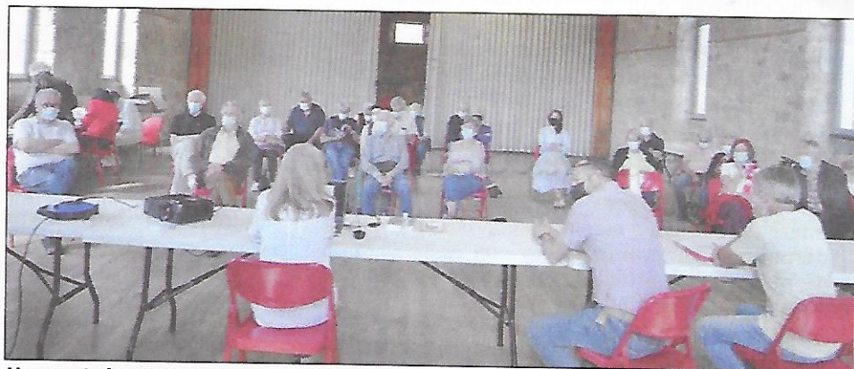
L'assemblée générale de l'association pour continuer la lutte

C'est encore une fois masqués que se sont rencontrés dernièrement les adhérents de l'association «Ranimons la cascade !» de Salles-la-Source pour leur Assemblée Générale. Cette rencontre a permis de faire un point complet et actualisé de la situation.